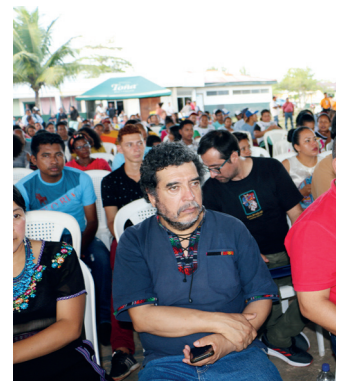
Delegados de la RUIICAY.