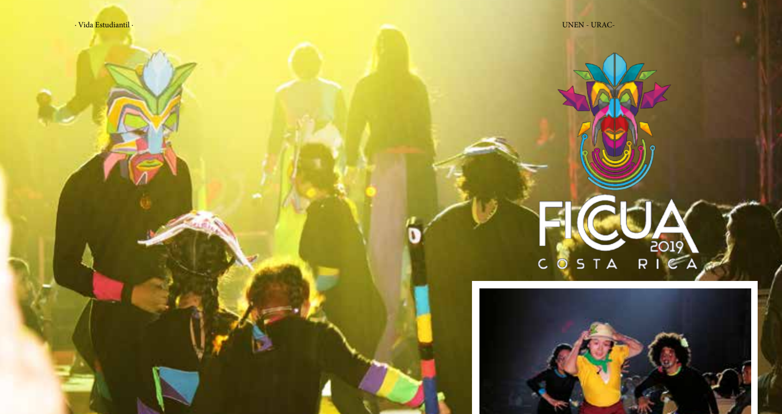
Parte de las presentaciones desarrolladas durante el acto inaugural del FICCUA 2019, en Costa Rica