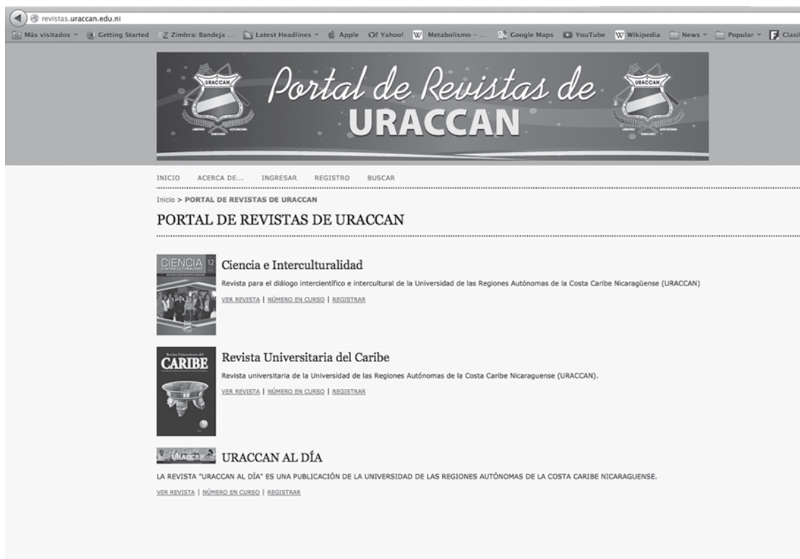
Figura No. 1. Portal de revistas de la URACCAN, disponible en: http://revistas.uraccan.edu.ni/index.php/index

Como se puede apreciar en el cuadro No. 1, el Portal de Revistas de la URACCAN (figura 1) ha sido un éxito completo en materia de difusión de la publicación científica de la Universidad y sus investigadores colaboradores. El monitoreo del período que comprende de junio del 2011 a octubre del 2013 refleja, 38,855 revisiones de resúmenes de artículos y 64,182 revisiones o descargar de artículos completos, lo anterior implica un promedio de 2,292 ingresos mensuales para revisar o descargar los artículos completos y 1,387 para revisar resúmenes.