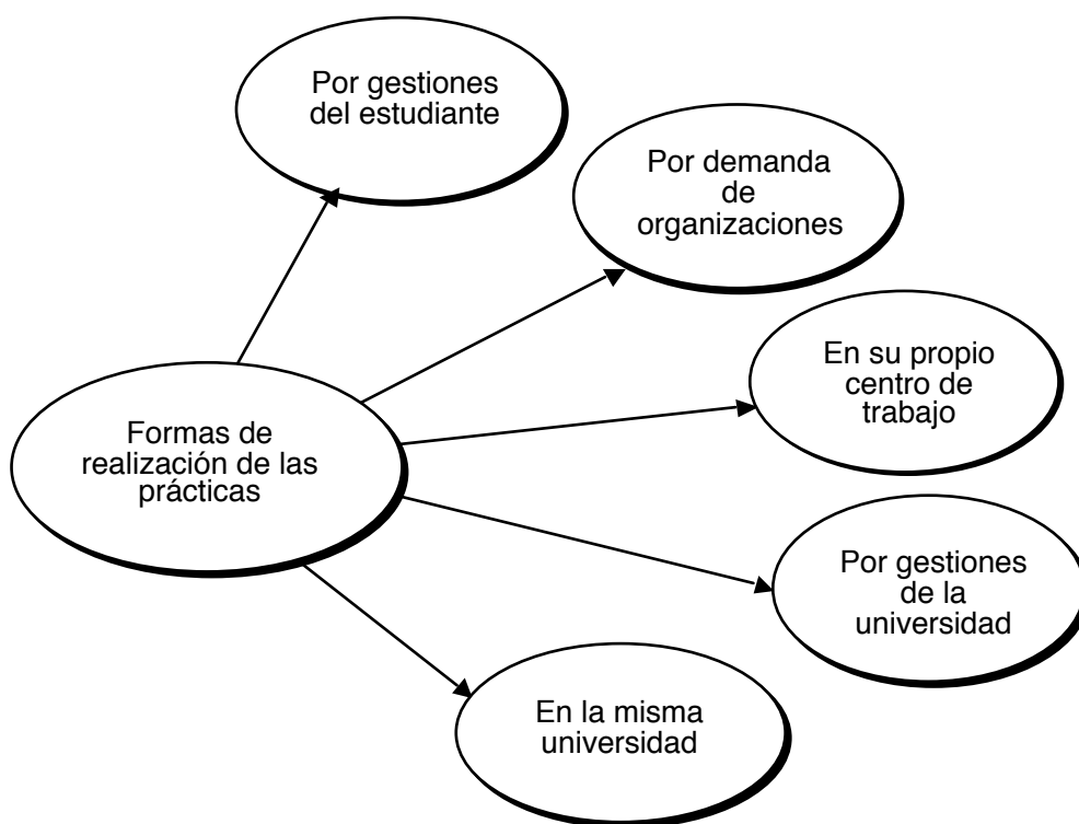
Gráfico No. 1: Formas de realizar las prácticas pre profesionales